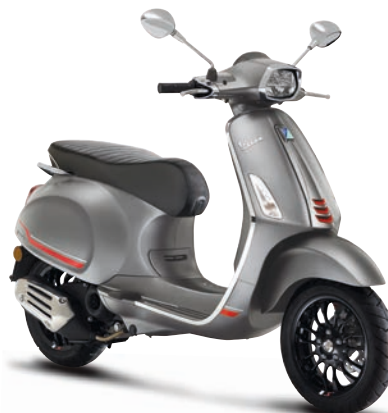
Grigio Travolgente matt