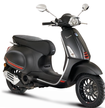
Nero Convinto matt