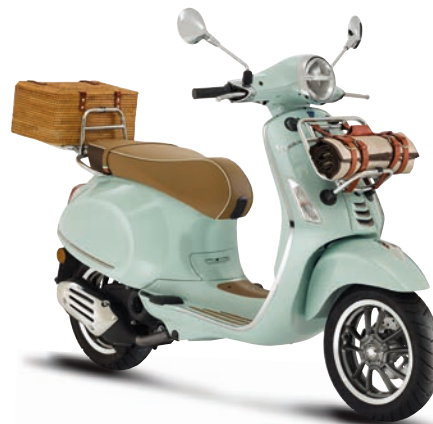
Verde Pic Nic