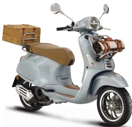
Grigio Pic Nic