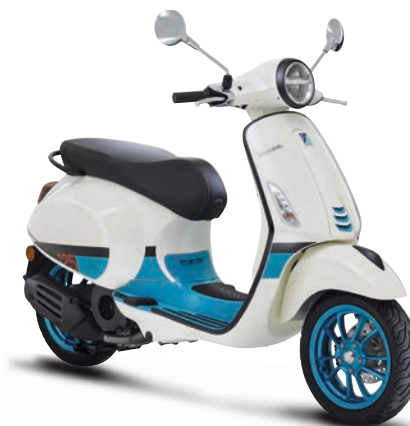
Bianco Color Vibe