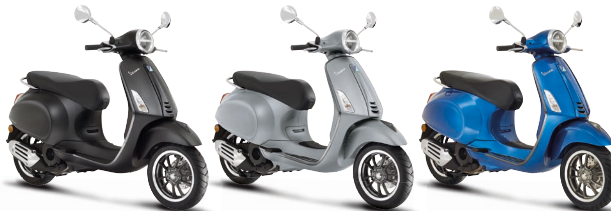
Nero Convinto matt