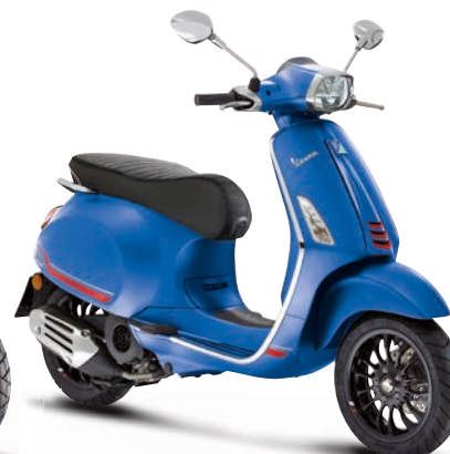
Blu Vivace matt**