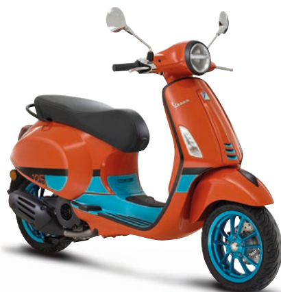
Arancio Color Vibe