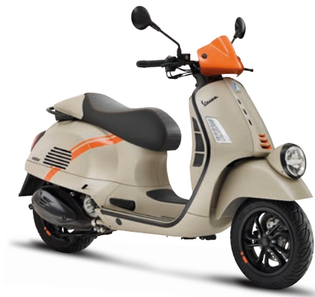
Beige Avvolgente matt*

NEW ca. ab September env. à partir de septembre